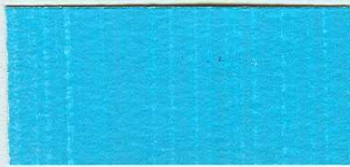
5039 Blankyt tyrkysový