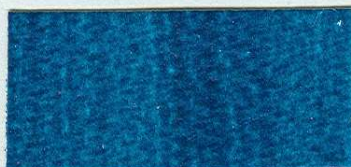
5076 Smaragd tyrkysový