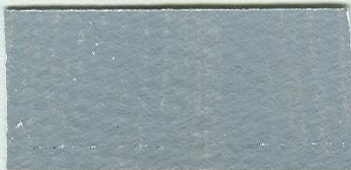
5077 Šedě neutrální/