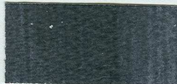
5073 Paynova šedě