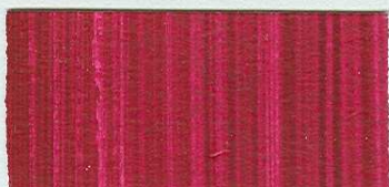
5022 Alizarin karmínový