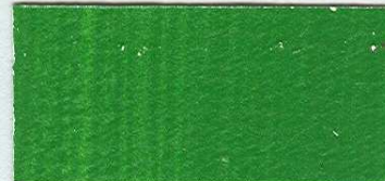
5036 Zeleně střední