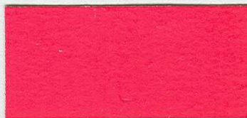
5020 Korálová červeně