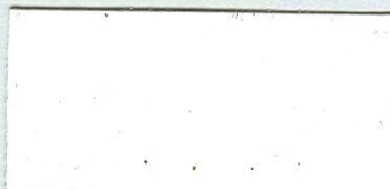
5004 Tónovací běloba/