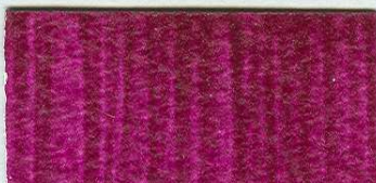
5023 Alizarin fialový