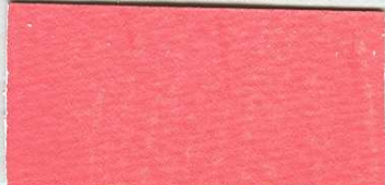
5010 Temná PIZ