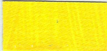
5057 Neapolská žlutě světlá