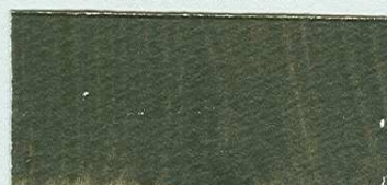
5050 Umbra přírodní