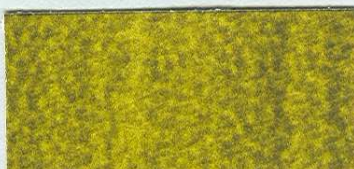
5058 Zeleně zlatá