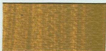
5042 Siena přírodní