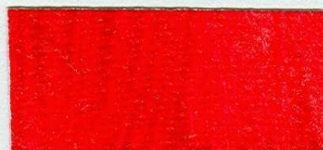
5018 Kadmium červené tmavé – odstín