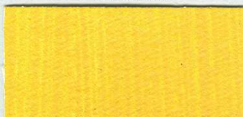
5056 Neapolská žlutě tmavá