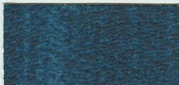
5001 Indigo – odstín