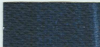
5029 Pruská modř – odstín