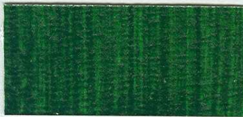
5038 Zeleně ščávní