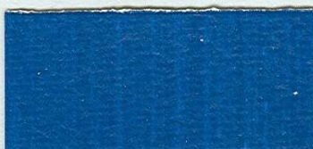
5033 Coelinová modř – odstín